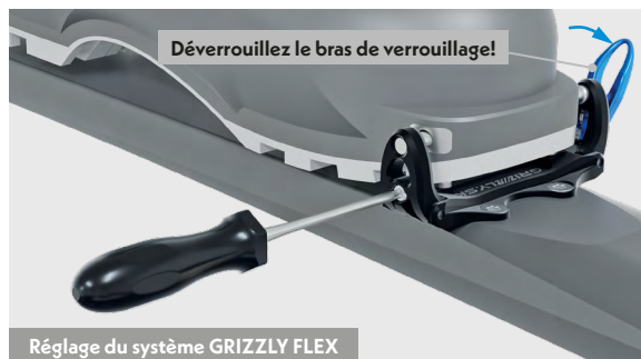
Réglage du système GRIZZLY FLEX

Si le bras fixe GRIZZLY FIX rend trop difficile le verrouillage et le déverrouillage de la butée de la fixation avec la chaussure de ski, il faut desserrer la vis du système GRIZZLY FLEX.