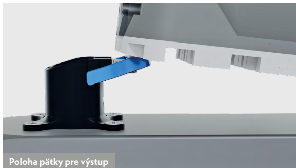
Poloha päťky pre výstup