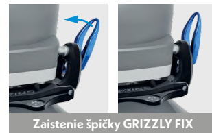
Zaistenie špičky GRIZZLY FIX