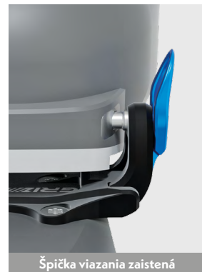
Špička viazania zaistená