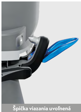
Špička viazania uvoľnená