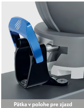
Pätka v polohe pre zjazd