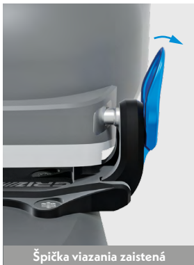
Špička viazania zaistená