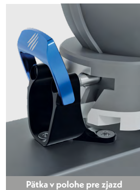
Pätko v polohe pre zjazd

Pätko viazania obsahuje hrazdičku (klapku), ktorá v preklopenom stave dopredu umožňuje chôdzu na lyžiach a v preklopenom stave dohora umožňuje upnutie päty lyžiarskej topánky pre zjazd.