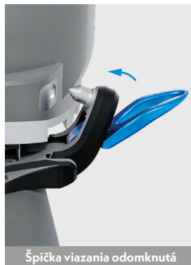
Špička viazania odomknutá

Keď je zaisťovacie rameno v kolmej polohe, špička viazania je uzamknutá.