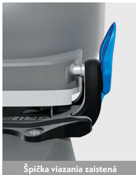
Špička viazania zaistená